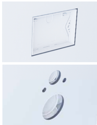
Défonçage suivant gabarit