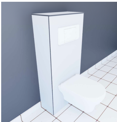
Option : 2 joues latérales